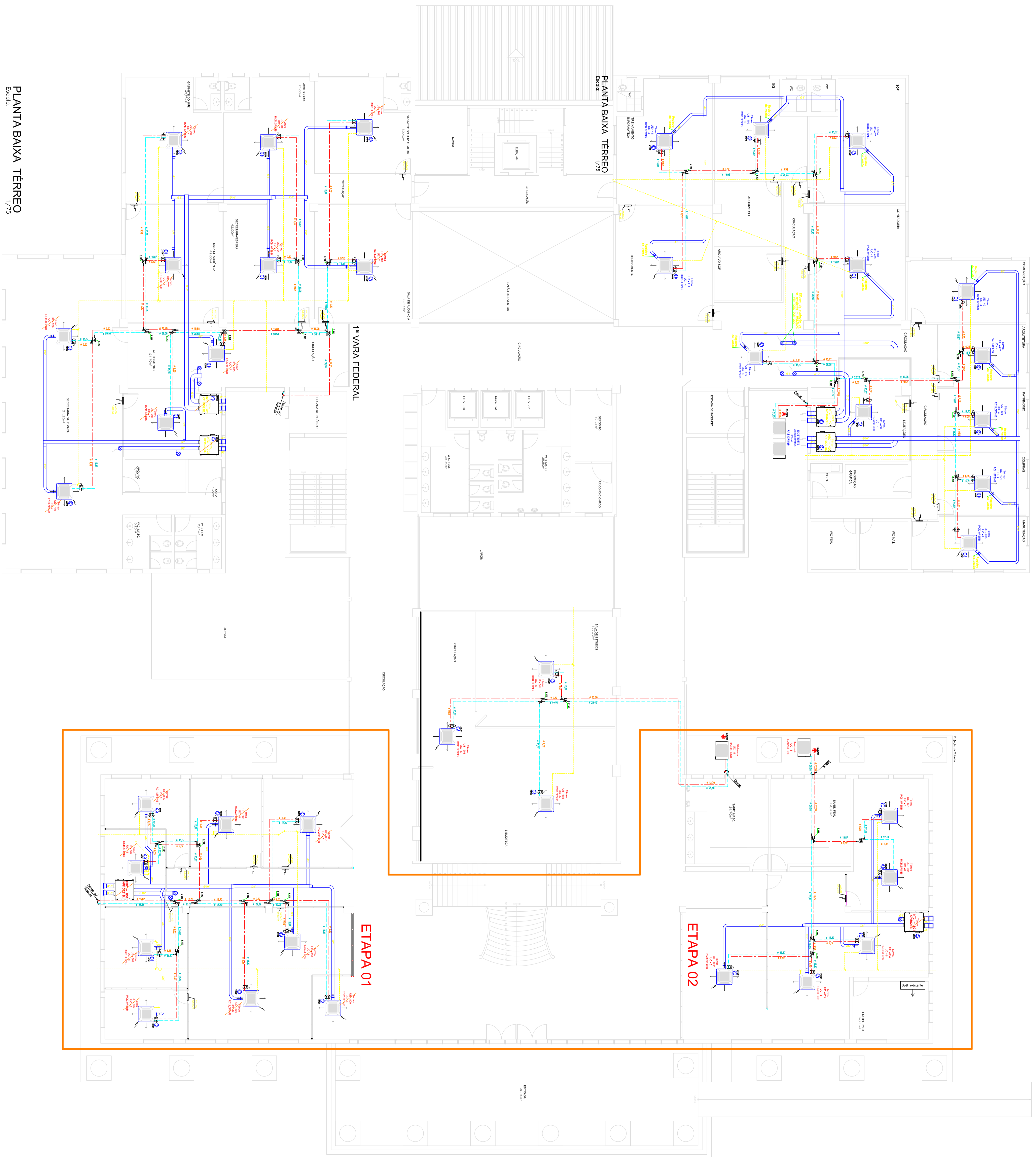
PLANTA BAIXA - TERREO 1/75